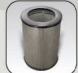
二合一雙重過濾器

清洗槽尺寸： 高92cm x 寬66cm x 深25cm 整體尺寸： 高102cm x 寬300cm x 深70cm 清潔劑用量：75公升