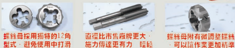
螺絲母採用獨特的12角型式，避免使用中打滑 直徑比市售廠牌更大，施力傳達更有力 輕鬆 螺絲母附有微調整螺絲，可以讓作業更加精準